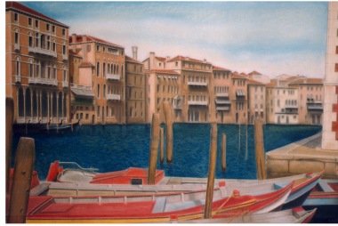
‘vanuit aandacht hier-en-nu naar richting’

Kortom, u zou eens zo’n training moeten bijwonen!”